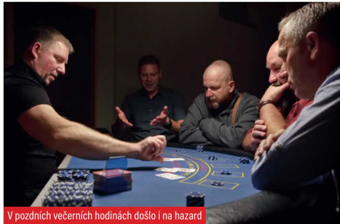
V pozdních večerních hodinách došlo i na hazard