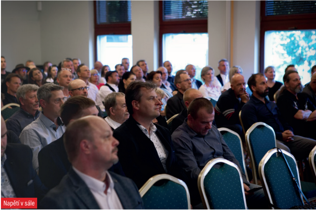
Napětí v sále