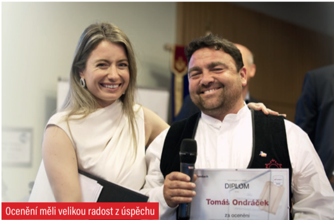
Ocenění měli velkou radost z úspěchu

Atmosféra slavnostního večera v zámeckém hotelu Loučeň, kde probíhalo vyhlášení výsledků soutěže Tondach Pálená střecha 2023, byla příjemná, veselá a s postupujícím časem a množstvím zkonsumovaných pochutin až bujará. Připomeňte si ji na fotkách, pokud jste se zúčastnili, nebo se inspiřte pro příště. Stačí svou povedenou střechu přihlásit do nového ročníku soutěže a za rok se takhle můžete bavit i vy.