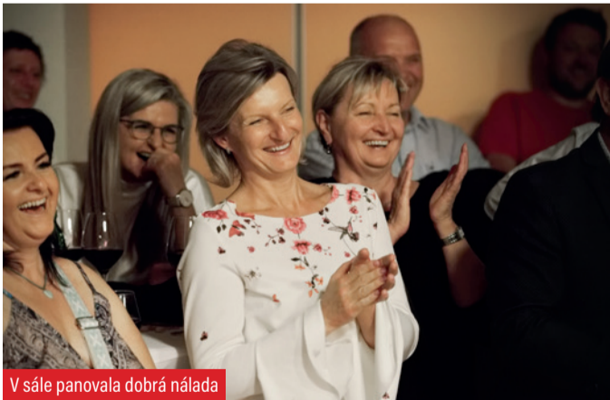
V sále panovala dobrá nálada