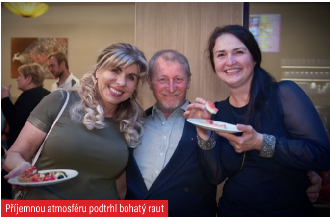
Příjemnou atmosféru podtrhl bohatý raut