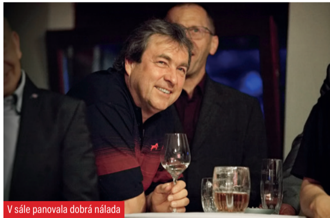
V sále panovala dobrá nálada